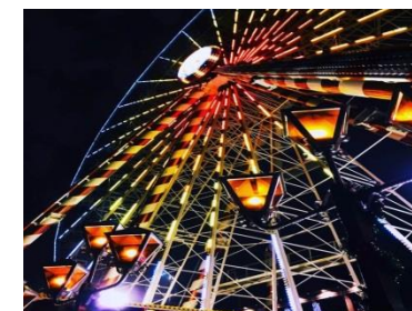
Concours photos « montre-moi ta ville du Havre »