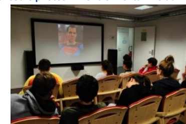
Projection sur le thème des héros en salle vidéo