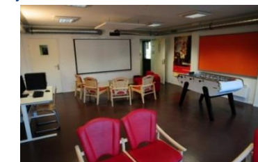
Salle de jeu, de détente