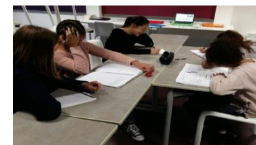
Les devoirs en petit groupe avec l'aide d'un adulte