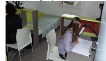
L'étude dans ma chambre : un adulte vérifiera